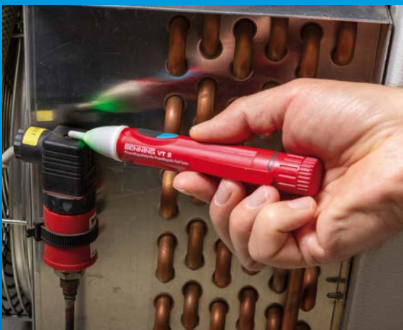
Prüfung eines Magnetventils mit BENNING VT 2