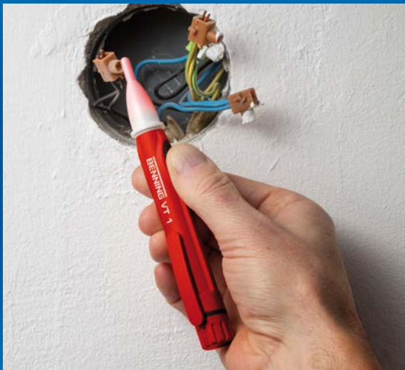
Phasenprüfung an Abzweigdose mit BENNING VT 1