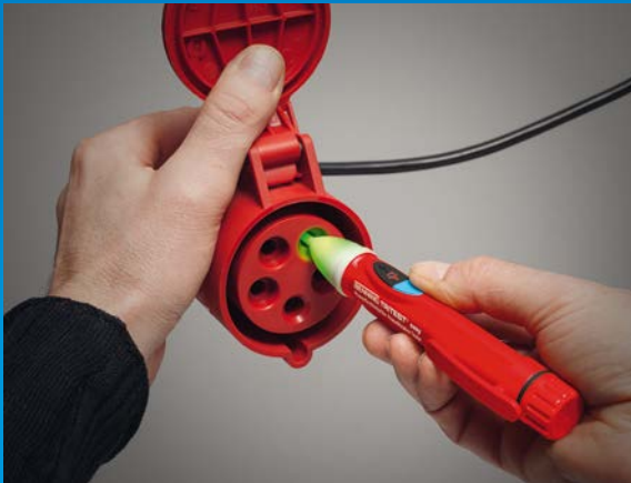
Drehfeldrichtungsprüfung an CEE-Kupplung mit TRITEST® easy