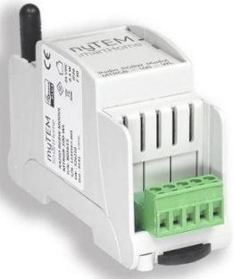
myTEM Radio RGBW Modul MTRGB-100-WL

Das myTEM Radio RGBW Modul MTRGB-100-WL ist ein Modul zum Steuern und Dimmen von 4-farbigen LED-Streifen. Neben der Rot-Grün-Blau-Weiss-Farbansteuerung kann auch eine Warmweiss-Einstellung realisiert werden, wenn der LED-Streifen diese Funktion unterstützt.