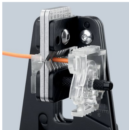
Sauberes Einschneiden der Isolation auf dem gesamten Umfang