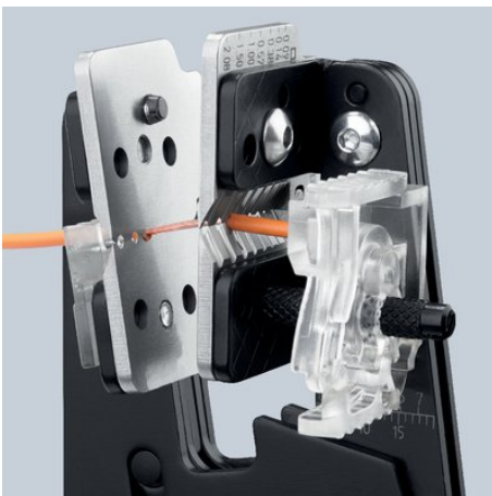
Dénudage suivant la forme du câble grâce aux profils coupants de précision

Kapton® est une marque déposée de E. I. du Pont de Nemours and Company Radox® est une marque déposée de Huber & Suhner AG