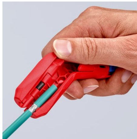
Dégainage d'un câble de données