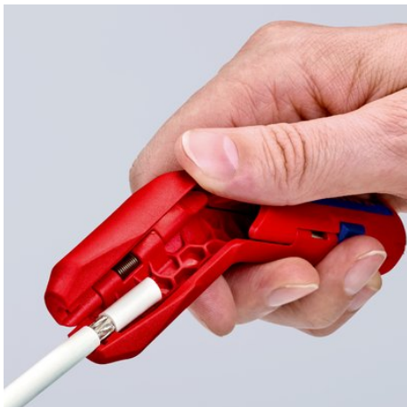
Dégainage d'un câble coaxial