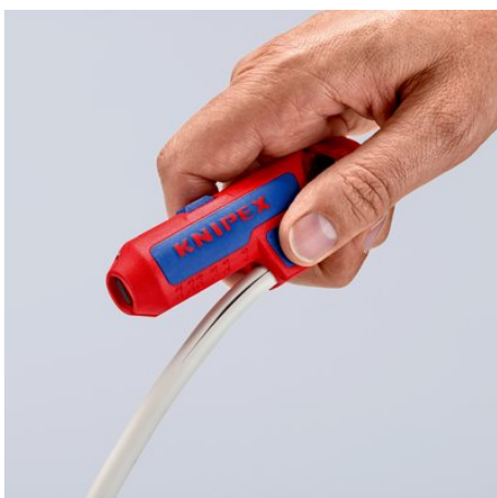
Avec une lame couverte dans une poignée en porte-à-faux latéral pour des coupes longitudinales faciles