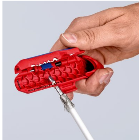
Dénudage d'un câble coaxial