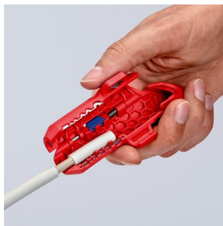
Dégainage d'un câble NYM