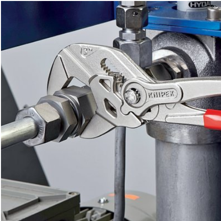
remplace tout un jeu de clés plates, métriques et en pouces