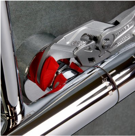
Pour robinetteries chromées sans endommager la surface