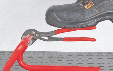
Gegen die Drehrichtung versetzte Zähne bewirken einen Selbstklemmeffekt und verhindern das Abrutschen am Werkstück.