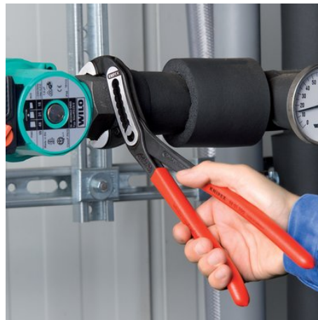
Autoserrante per tubi e dadi: nessuno scivolamento sul pezzo; l'intera capacità di azionamento può essere applicata per ruotare i pezzi; non è necessario premere con forza i manici della pinza, quindi minore sforzo