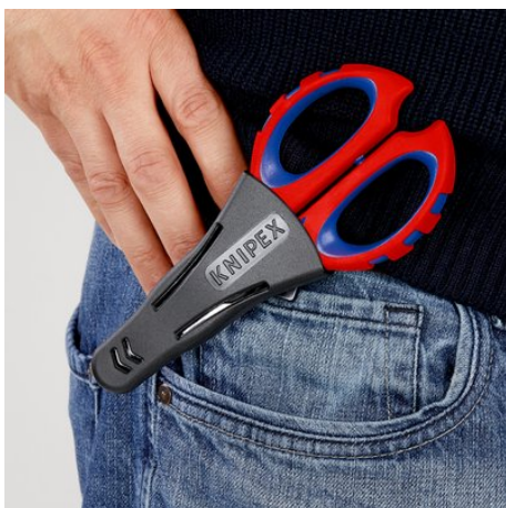
!Sicher verstaut und immer griffbereit!

Con riserva di modifiche tecniche e salvo errori