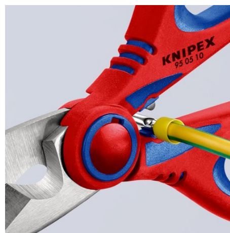
95 05 10 SB: Crimpatura rapida e semplice