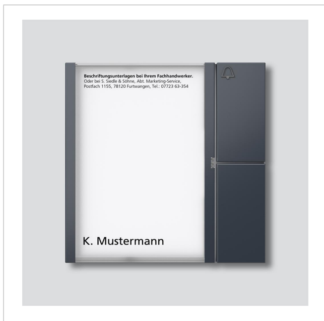
Modulo tasti TM 612-1 AG 210004997-00