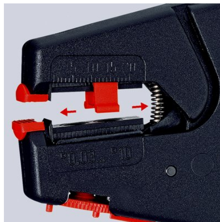
12 40 200: Butée longitudinale réglable